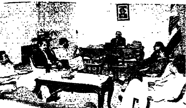
اجتماع الرؤساء الجميل والحسيني وكرامي

رئيس الجمهورية الشيخ امين الجميل التقى امس رئيس الحكومة السيد رشيد كرامي من خلال اتصاله ولقاءاته على معالجة الأوضاع الأمنية بهدف الانطلاق في الحل السياسي... (The text continues with details of the meeting and the political situation.)